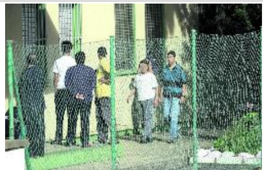
La Montañeta. Menores internados en el centro de La Montañeta, en Gran Canaria.

Tras la visita, el juez de Menores reclamó al Ejecutivo canario y a la Fundación Ideo el cese del director del centro.